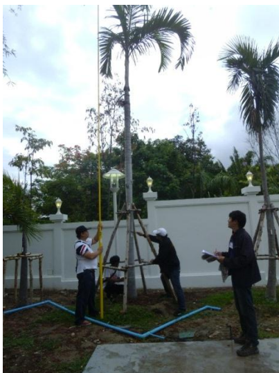
ภาพที่ ๑ - ๒ เจ้าหน้าที่ทำการตรวจวัดตัดป้ายเพื่อจัดทำฐานข้อมูล